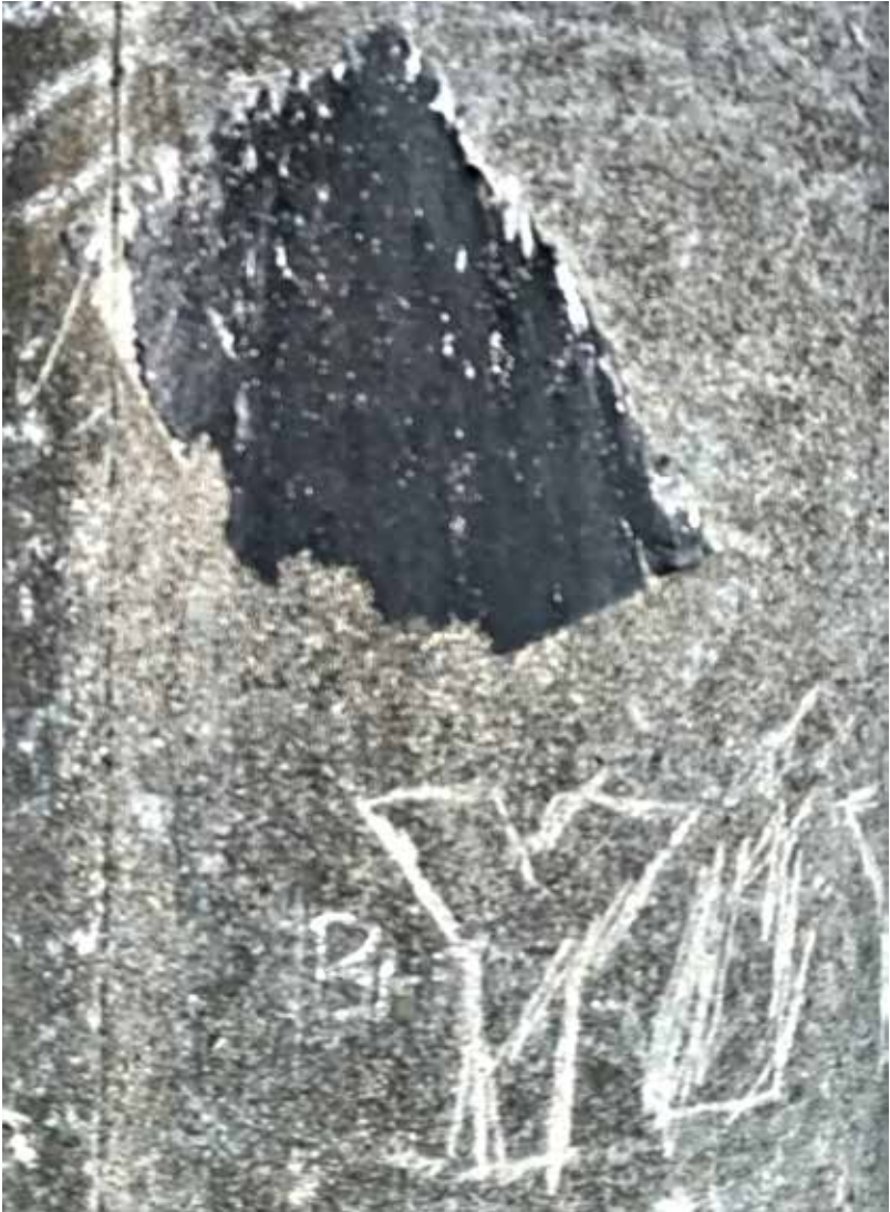
Anónimo Poéticas Urbanas. 2023