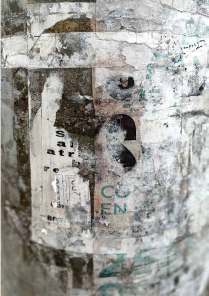
Anónimo Poéticas Urbanas. 2023