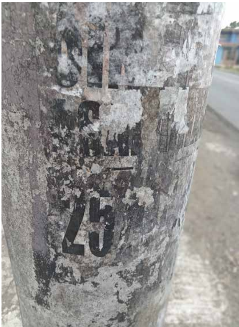
Anónimo Poéticas Urbanas. 2023