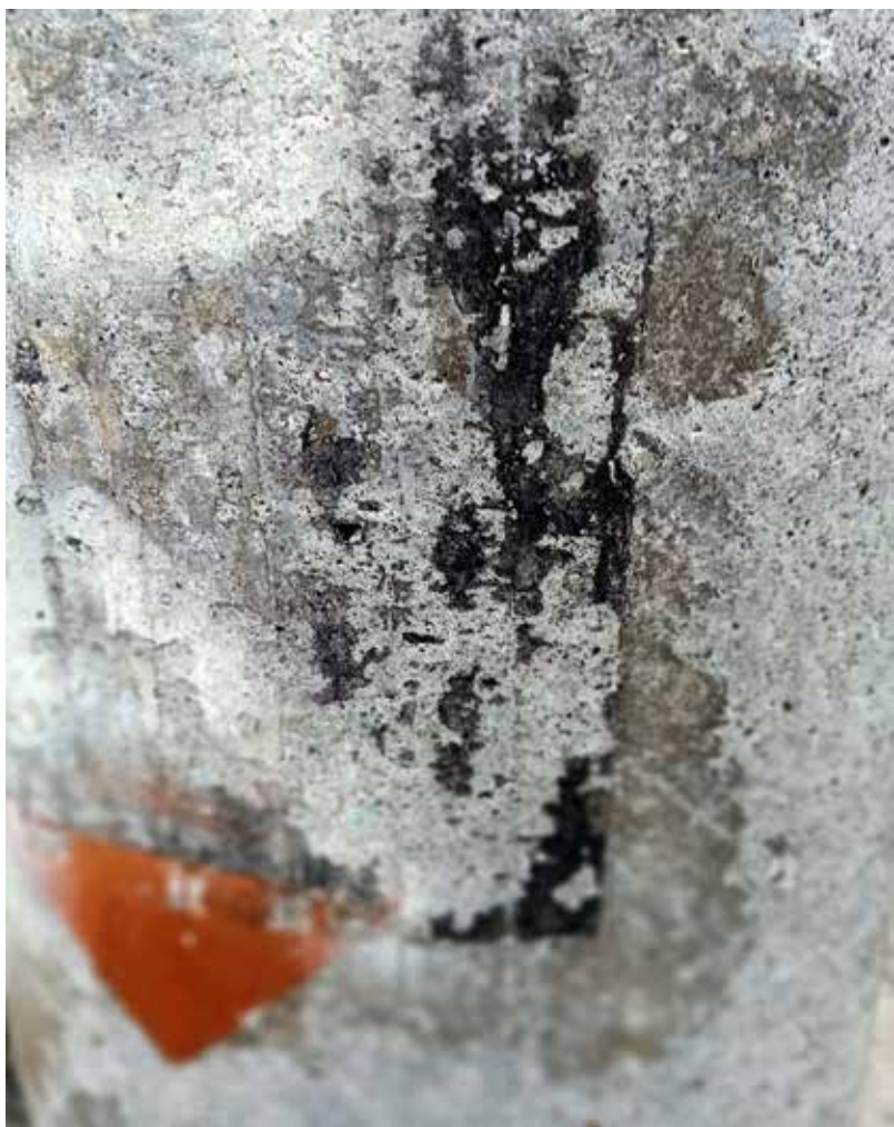
Anónimo Poéticas Urbanas. 2023