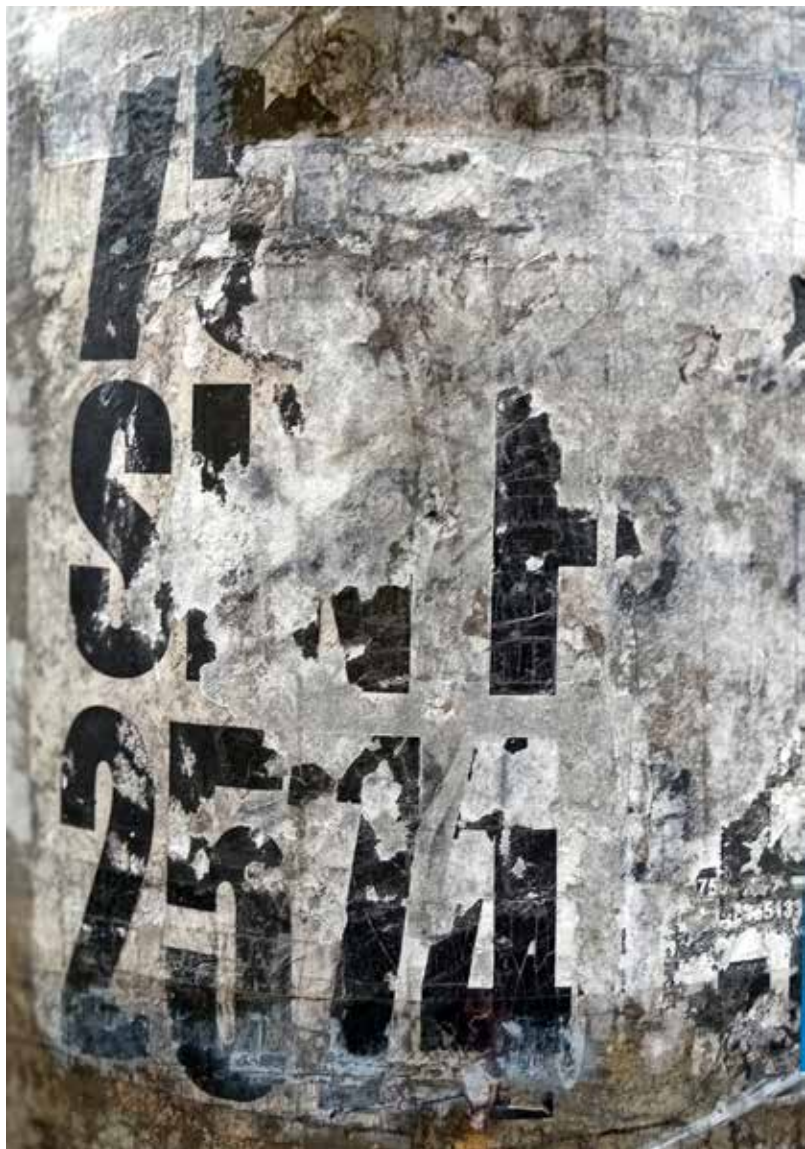
Anónimo Poéticas Urbanas. 2023