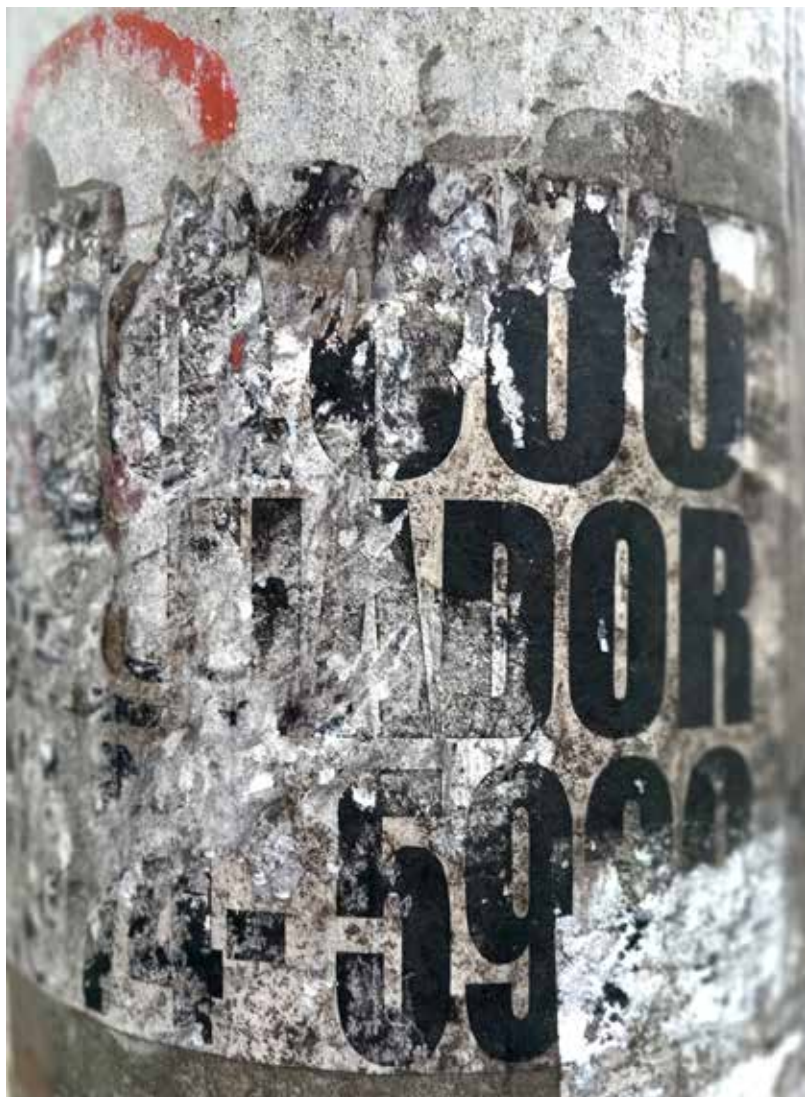
Anónimo Poéticas Urbanas. 2023