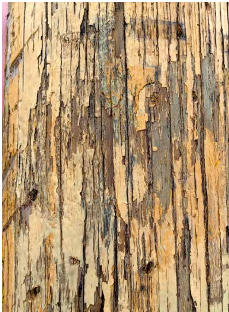
Anónimo Poéticas Urbanas. 2023