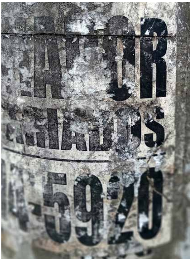
Anónimo Poéticas Urbanas. 2023